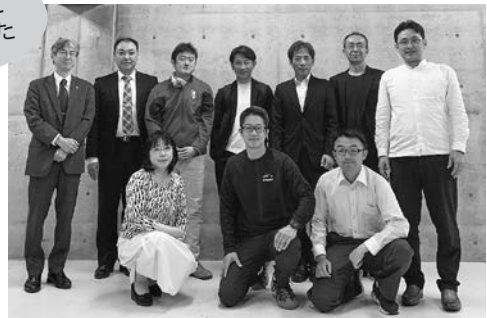
役員会のメンバー (一部)

この度、広報委員長よりお声がけいただき、同窓会だよりの編集に携わることになりました。これまで同窓生のご活躍や母校の様子を楽しみに拝見しておりましたが、紙面作りに参加する立場ということで少々緊張しております。